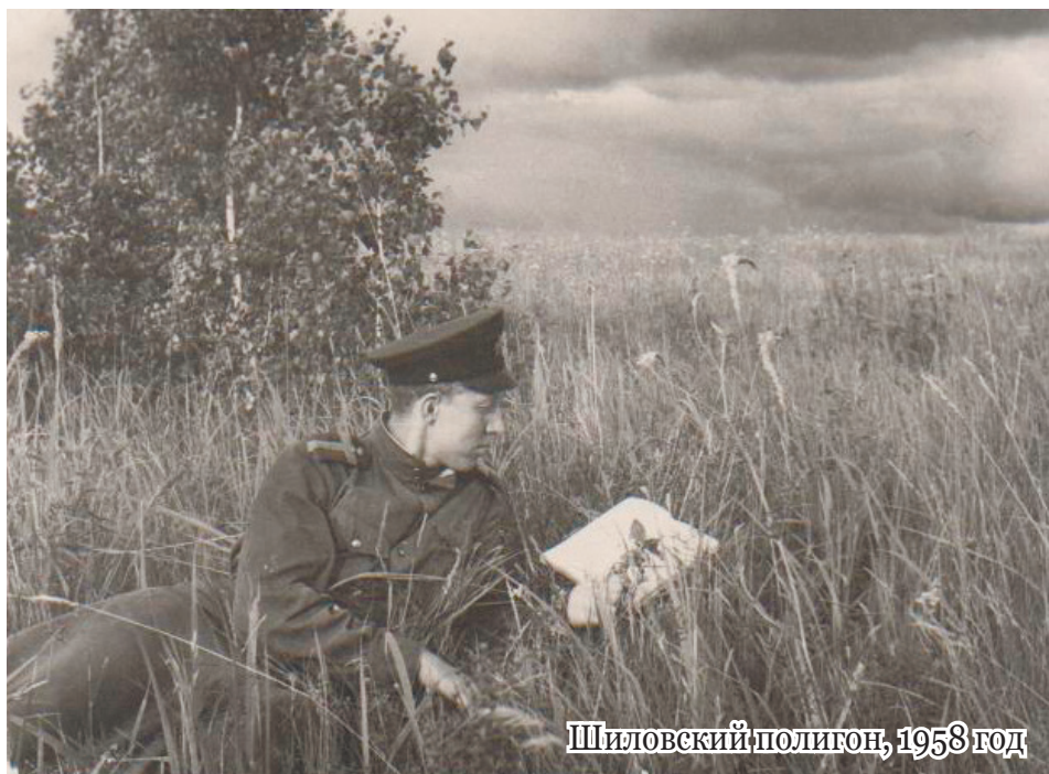
Шилковский полигон, 1958 год