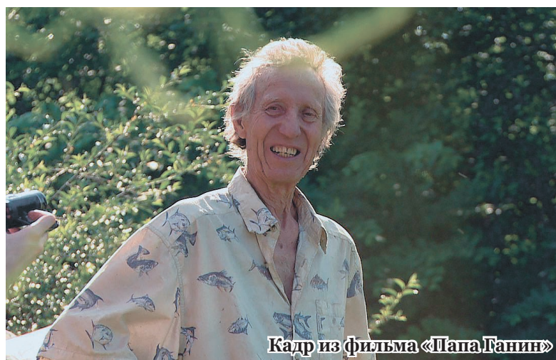
Кадр из фильма «Папа Ганин»

ПРОФКОМ сотрудников и преподавателей НГМУ переехал в кабинет № 111 (левое крыло 1 этажа главного корпуса)