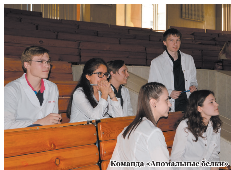
Команда «Аномальные белки»

ТЕКСТ: заведующая кафедрой медицинской химии Д.В. Суменкова