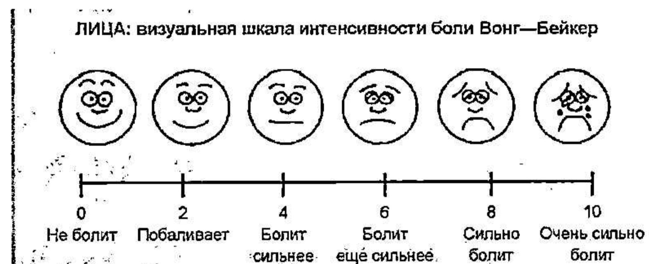
Рис. 1 Визуально-аналоговая шкала оценки боли

Диагностика боли в родах основана только на субъективных ощущениях женщины и характеристика боли, как чрезмерная, является показанием для обезболивания родов. Может использоваться визуально-аналоговая шкала оценки боли (ВАШ) (рис. 1)