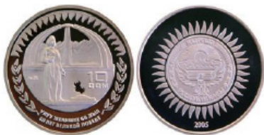
Монета «60-летию Победы в Великой Отечественной войне». 2005 год

Ниже рассмотрим 3 выпуска серебряных и 1 выпуск медно-никелевых монет Кыргызской республики в 2005, 2015 и 2020 годах. Ознакомимся с их внешним видом, оформлением и характеристиками.