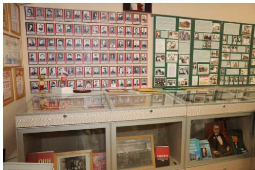
Стенд «Преподаватели НГМИ в годы войны» в ИПЦ НГМУ

Сотрудниками и студентами НГМИ оказывалась помощь оборонным предприятиям города, в летний период – сельскому хозяйству (участие в посевной, прополочной, сенокосной, а затем и в уборочной кампаниях). За годы войны коллективом института было отработано более 112000 человеко-дней в промышленности и сельском хозяйстве без отрыва от учебных занятий.