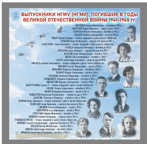
Стенд погибшим выпускникам НГМИ

К сожалению, судьба многих выпускников Новосибирского медицинского института и студентов, ушедших добровольцами на фронт, сложилась трагически. Часть из них погибла на фронтах Великой Отечественной войны, кто-то пропал без вести. Благодаря поисковой работе студентов НГМИ в 1980-е годы были установлены имена 25 погибших студентов НГМИ. Новые возможности изучения архивных материалов через сайты «Мемориал» и «Под-