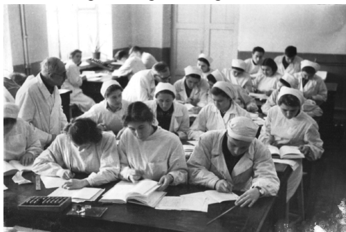
Занятия в НГМИ, 1940-е

Великая Отечественная война была серьёзным испытанием для всей системы здравоохранения. Важ-