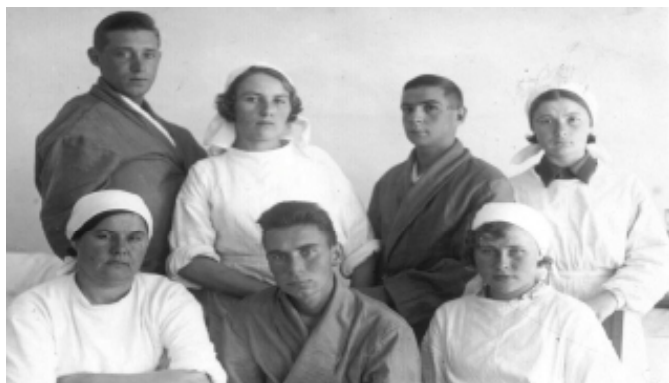
Медицинский персонал и раненые в военном госпитале Новосибирска