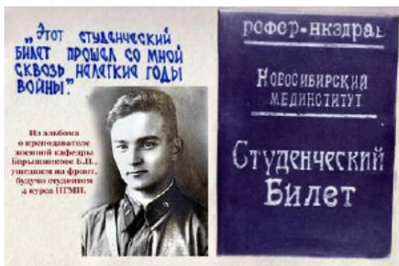
Рисунок 1. Студент НГМИ в 1942 году

Новосибирском ГИДУВе за годы войны прошли специализацию 9355 врачей, треть из которых была также направлена на фронт. За героизм, проявленный ими при оказании помощи бойцам и командирам Красной Армии, многие были отмечены орденами и медалями Советского Союза. [2]