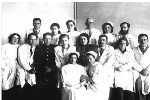
Кафедра госпитальной хирургии, 1940-е

сов военно-полевой хирургии, военной гигиены, травматологии, нейрохирургии, инфекционных болезней, эпидемиологии и др., что позволяло целенаправленно готовить врачей для работы в военных условиях как на фронте, так и в эвакогоспиталях в тылу. При этом увеличивалась учебная нагрузка в неделю и продолжительность учебного дня, сокращались каникулы.