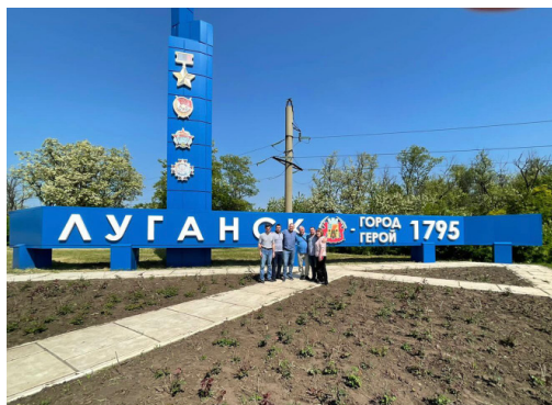
Преподаватели НГМУ в Луганске, 2022

дущее, за то, чтобы в мире не было места фашизму, который при поддержке западных недружественных стран вновь показал своё лицо на Украине. Пропаганда украинского режима, направленная на обесчеловечивание русских и отмену всего, что связано с русской культурой и народом, сегодня работает ничуть не хуже, чем машина гитлеровской пропаганды во время Великой Отечествен-