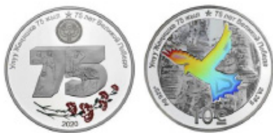
Монета. «75 лет Великой Победе». 2020 год

Номинал – 10 сом, металл – серебро 925°, вес – 28,28 г, диаметр – 38,60 мм, качество – proof, тираж – 1000 шт.