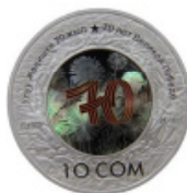
Монета «70 лет Великой Победе». 2015 год

Номинал – 10 сом, металл – серебро 925°, вес – 28,28 г, диаметр – 38,60 мм, качество – proof, тираж – 1000 шт.