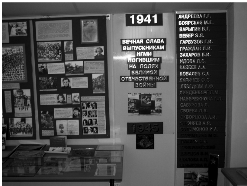
Стела погибшим выпускникам НГМИ в Историко-просветительском центре НГМУ

в тылу, а также имен выпускников, погибших или пропавших без вести. Сегодня их имена представлены на стендах, которые расположены в корпусах университета, на страницах сайта НГМУ, в виртуальном музее Историко-просветительского центра вуза.