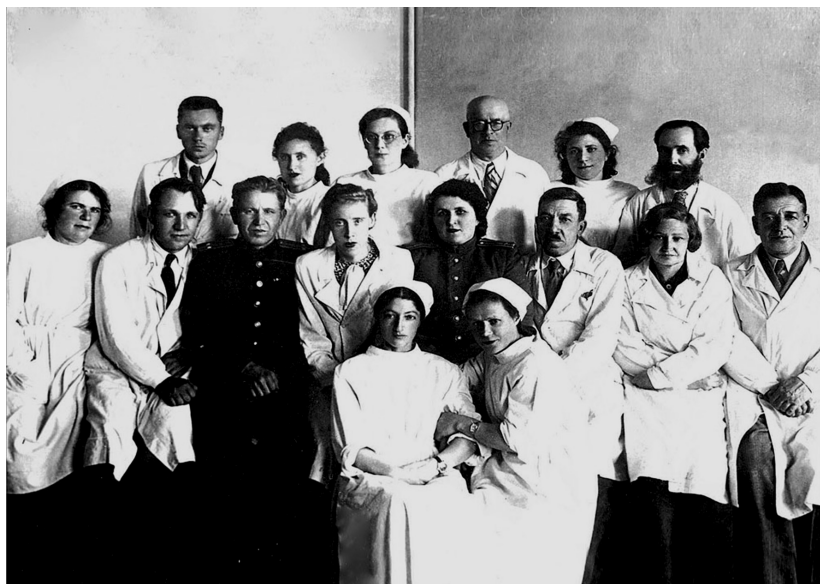
Кафедра госпитальной хирургии в урологическом госпитале, 1942 г.