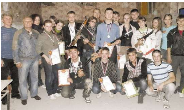
Сборная команда НГМУ по стрельбе на открытом чемпионате Новосибирской области по пулевой стрельбе