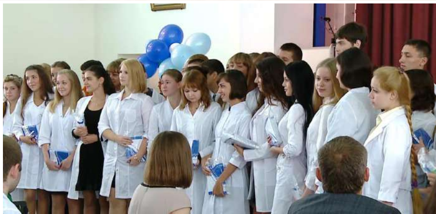
Посвящение в студенты стоматологического факультета

В малом зале главного корпуса НГМУ прошла внутривузовская олимпиада по латинскому языку и анатомической терминологии . Призовые места заняли команды лечебного