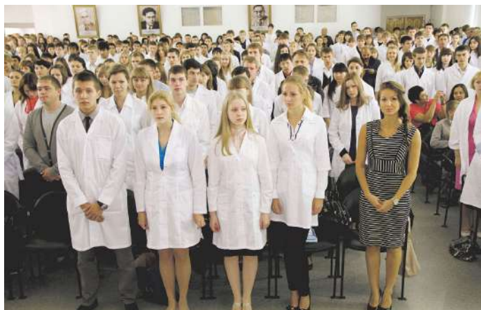
Посвящение в студенты на лечебном факультете