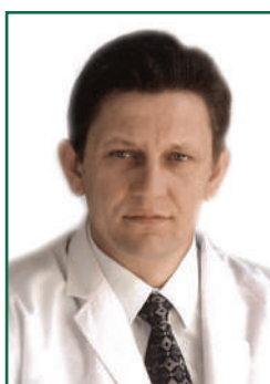
Зав. кафедрой сердечно- сосудистой хирургии, академик РАМН А.М. Караськов