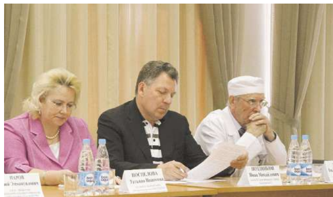
Круглый стол «Деонтологические аспекты при тяжелых и пограничных состояниях пациентов»