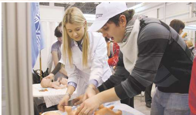
На стенде НГМУ на ярмарке «УчСиб-2012»