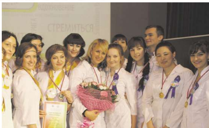
Победители олимпиады по акушерству и гинекологии