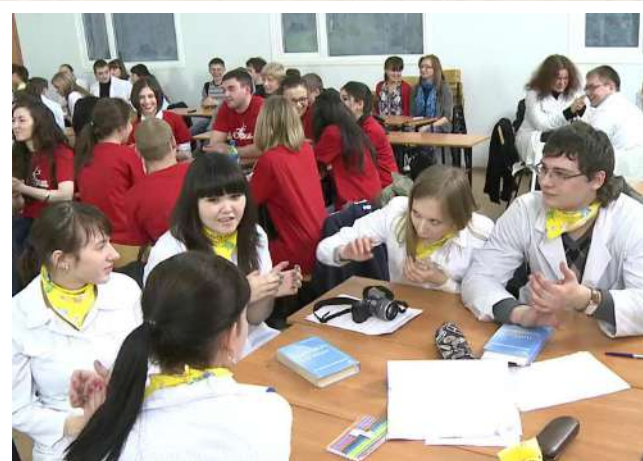
Внутривузовская олимпиада по латинскому языку и анатомической терминологии