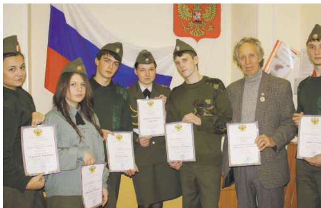
Студенты НГМУ – курсанты переменного состава Центра героико-патриотического воспитания «Пост № 1»

для работы с особо опасными инфекциями. По завершении семинара студенты получили сертификаты участников.