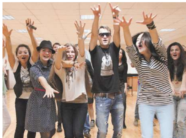
Участники творческих конкурсов на фестивале-субботнике студентов, проживающих в общежитии