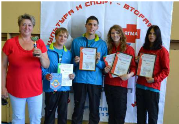
Команда НГМУ по плаванию на фестивале спорта «Физическая культура и спорт – вторая профессия врача» (г. Ярославль)