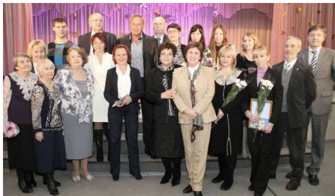
Церемония награждения медалью «За вклад в развитие Новосибирской области»