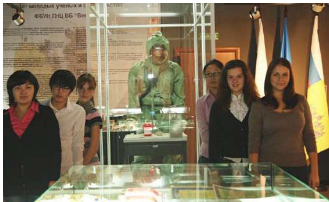
Студенты медико-профилактического ф-та в ГНЦ ВБ «Вектор»