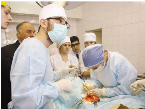
V Новосибирская олимпиада по хирургии