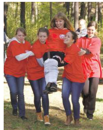
На конкурсе санитарных дружин

ожогах, ушибах и переломах. В перерывах между конкурсами команды продемонстрировали свои творческие способности. Победителем стала команда «МОСН» , 2 место заняла команда «Перископ» , 3 место – команда «Команда № 7» , 4 место – команда «Полный чепец» .