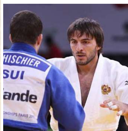
Чемпион мира по дзю-до, м.с.м.к. К. Магомедов