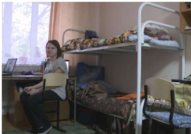
На конкурсе «Создаем уют своими руками» среди студентов, проживающих в общежитии