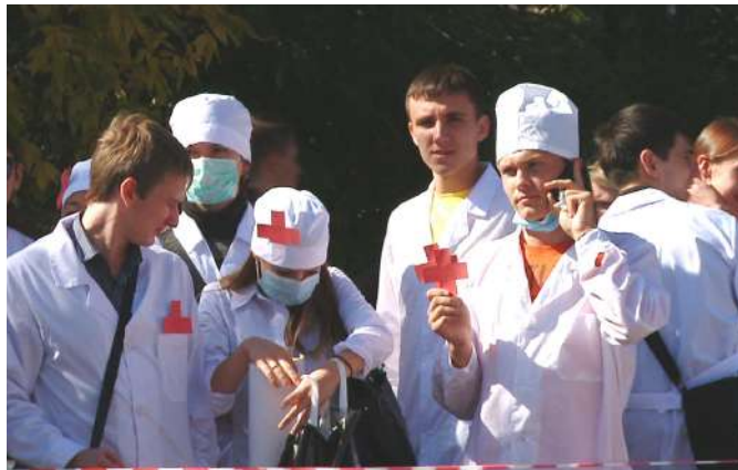
Фестиваль первокурсника «Мы в ответе за здоровье»