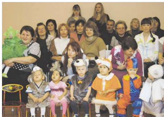
Студенты педиатрического факультета на новогоднем празднике в Доме малютки № 2

состава Центра героико-патриотического воспитания «Пост № 1», студенты, кроме несения караула, прошли строевую подготовку, упражнялись в стрельбе и разборке-сборке автомата.