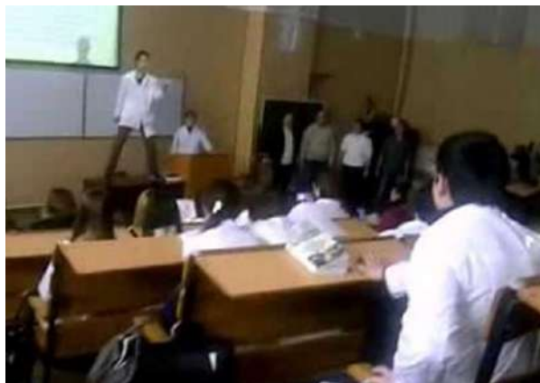
Флэшмоб артистов театра оперы и балета в НГМУ в рамках проекта «Мы перепоем этот город»