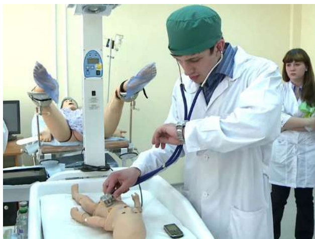
I всероссийская олимпиада по педиатрии