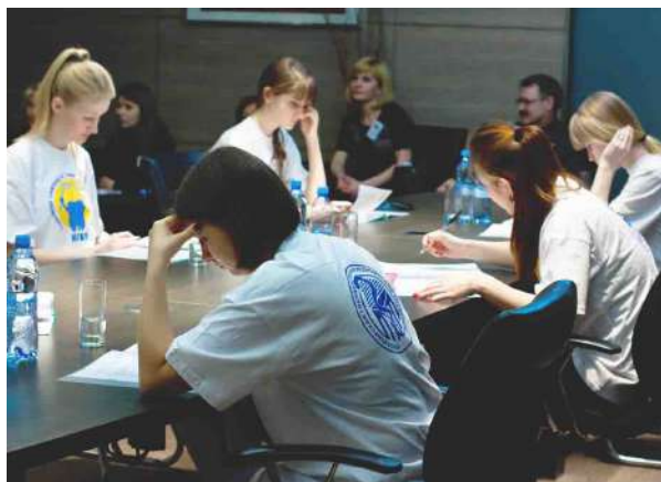
Внутривузовская олимпиада по терапевтической стоматологии «Эндодонтическое мастерство»