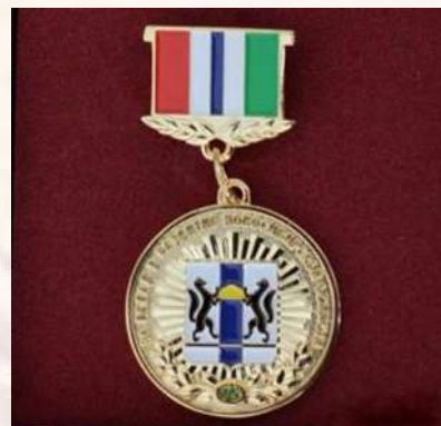
Медаль «За вклад в развитие Новосибирской области»