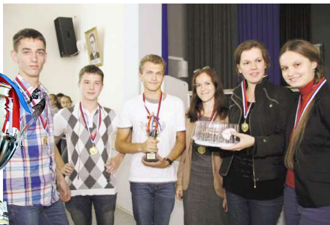
Команда – победитель интеллектуального кубка первокурсника «Что? Где? Когда?»