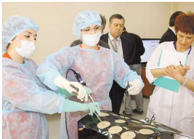
I Международная олимпиада по акушерству и гинекологии