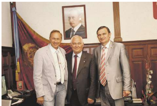
Президент Национальной медицинской палаты Л.М. Рошаль на мероприятиях, посвященных 20-летию областной ассоциации врачей