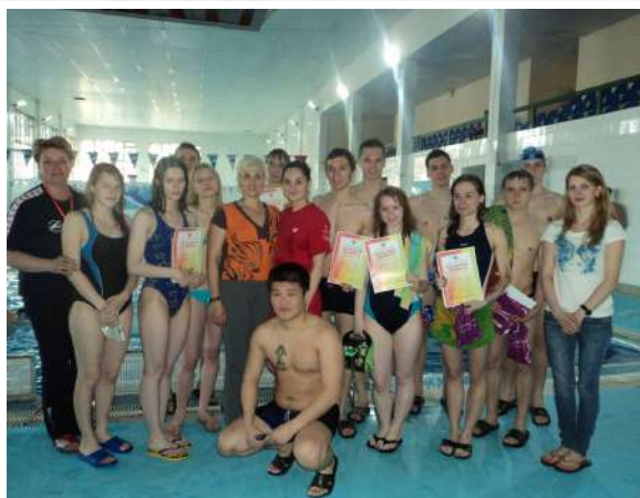
Команда л.ф. по плаванию на спартакиаде «Приз первокурсника»