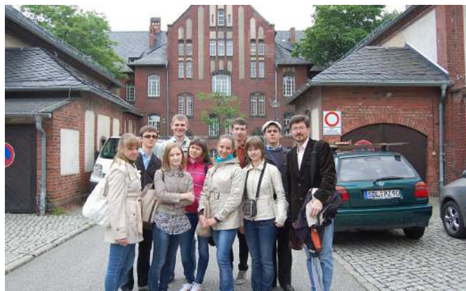
Студенты НГМУ в Германии по программе международной академической мобильности

ге посетили Медицинский факультет Лейпцигского университета, в Дрездене – Медицинский факультет им. Карла Густава Каруса Технического Университета Дрездена, институт физиологии.