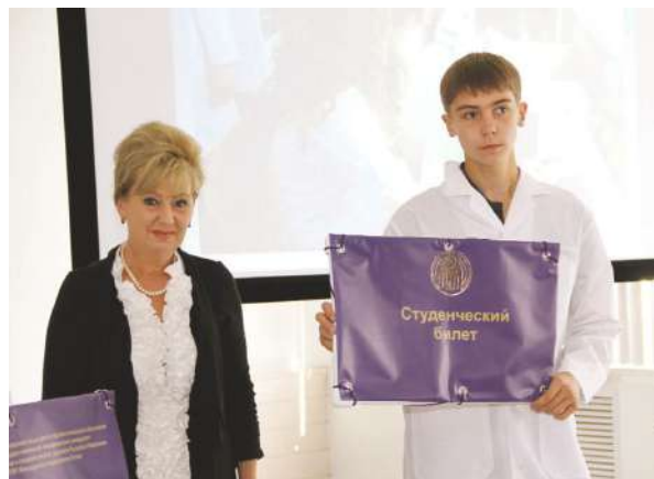
Посвящение в студенты на медико-профилактическом факультете