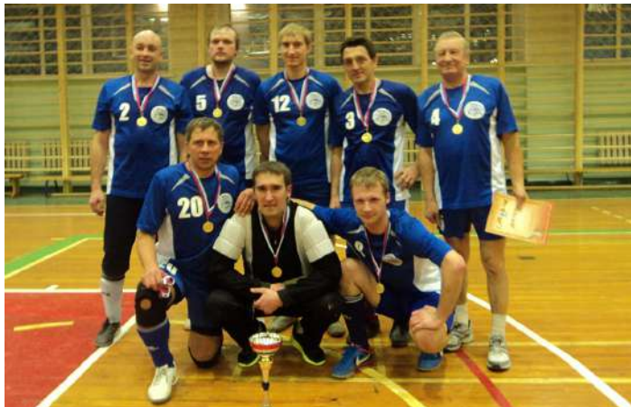
Команда преподавателей и сотрудников НГМУ по мини-футболу на спартакиаде «Бодрость и здоровье»

Соревнования по бадминтону : лечебный факультет – 2 место юноши и 4 место девушки; педиатрический факультет – 1 место юноши и девушки; стоматологический факультет – 4 место юноши и 2 место девушки; непрофильные факультеты – 3 место юноши и девушки.