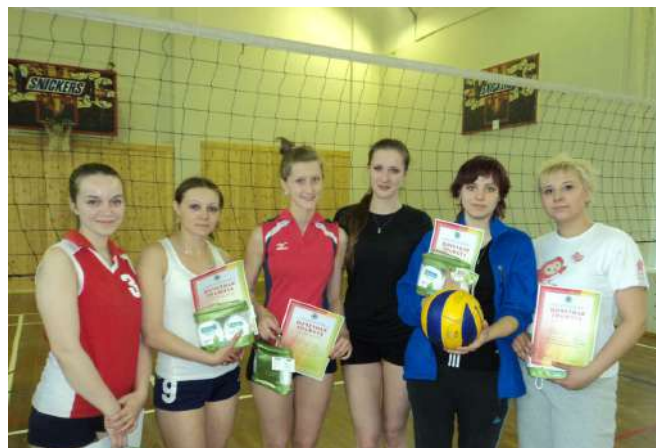
Команда по волейболу на спартакиаде студентов и аспирантов НГМУ