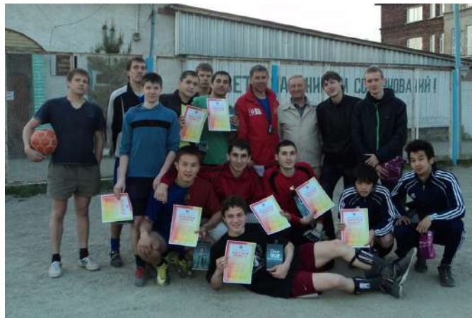
Команда по мини-футболу на спартакиаде студентов и аспирантов НГМУ

ческого факультета, 3 место – команда стоматологического факультета, 4 место – сборная непрофильных факультетов.