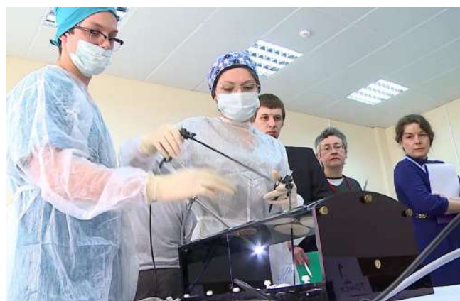
III внутривузовская олимпиада по акушерству и гинекологии