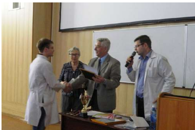
Внутривузовская олимпиада по нормальной физиологии