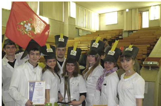
Внутривузовская олимпиада по истории, посвященная 200-летию Бородинского сражения и Отечественной войне 1812 г.