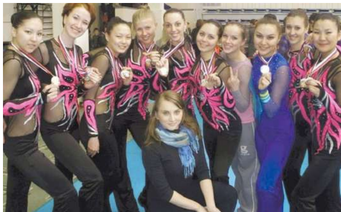
Сборная команда НГМУ по аэробике на чемпионате и первенстве Сибирского Федерального округа