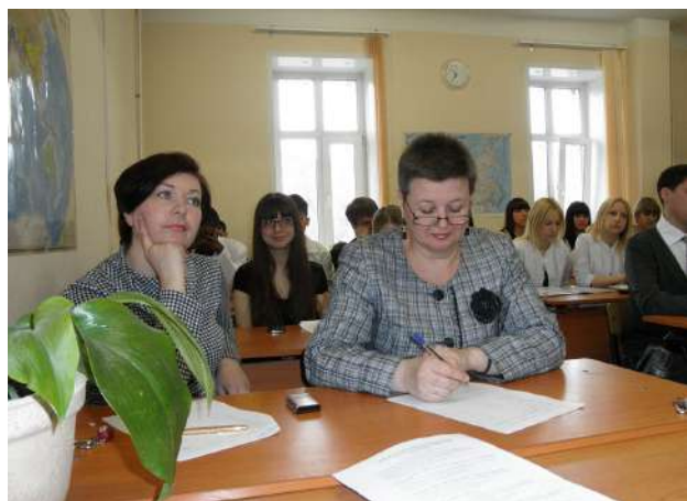
Заседание секции социально-исторических наук на конференции студентов и молодых ученых «Авиценна-2012»