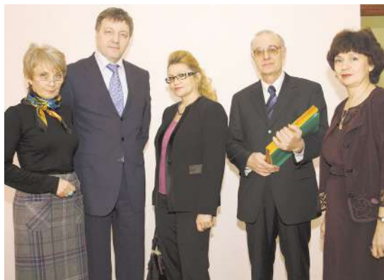
День НГМУ в Кировском районе