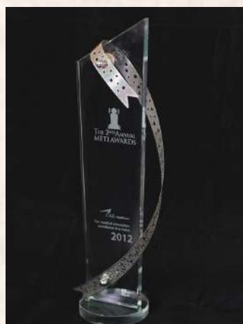
Кубок победителя в международном конкурсе студенческих видеофильмов