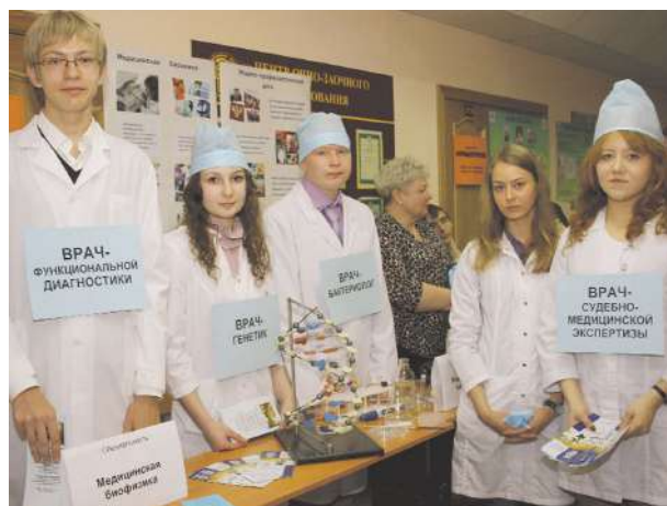
День открытых дверей в НГМУ