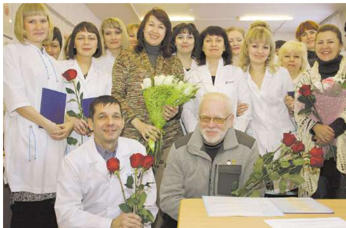
Выпускники фармацевтического факультета