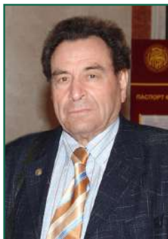
Академик РАМН Г.С. Якобсон