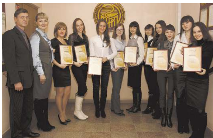
Победители конкурса на стипендию «Nyscomed – Золотые кадры медицины»