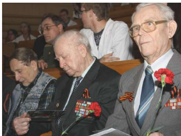
Ветераны НГМУ на торжественном вечере «Никто не забыт, ничто не забыто»