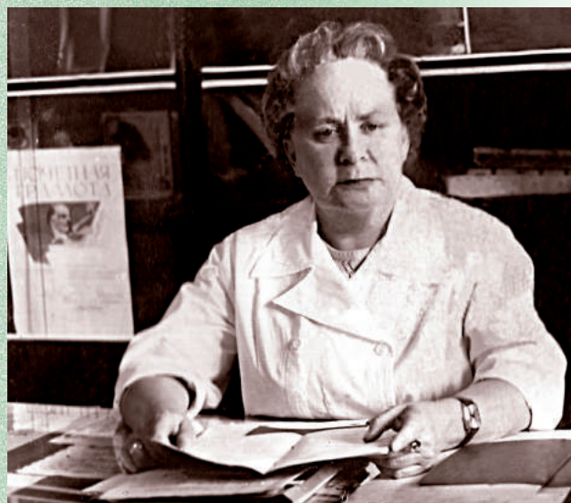
В рабочем кабинете