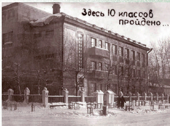
Средняя школа № 50, Новосибирск, 40-е годы