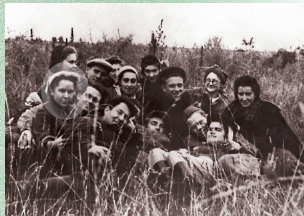
В колхозе, 1948-1949 уч.г.