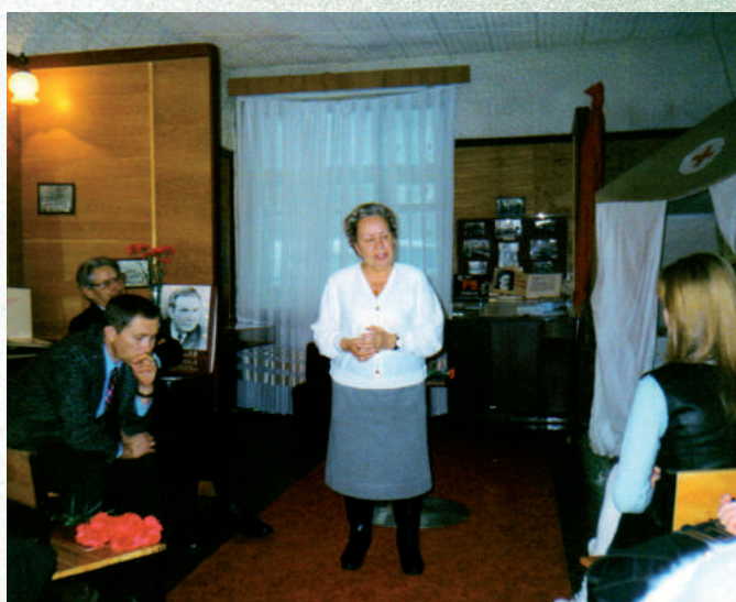
На встрече, посвященной годовщине со дня создания кафедры истории КПСС и политэкономики (ныне – кафедра социально-исторических наук) в музее НГМИ (морфологический корпус), 1989