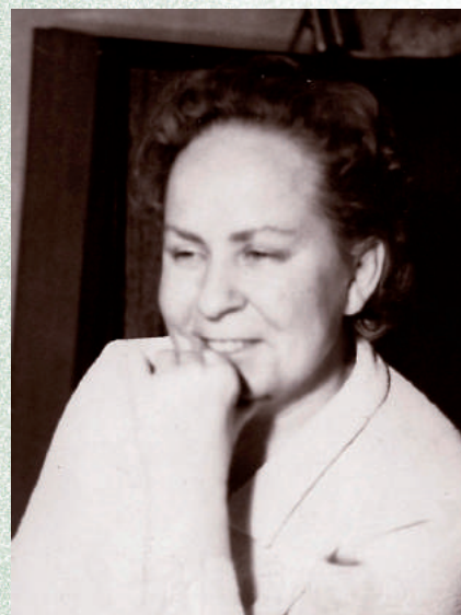
Улыбка на все времена