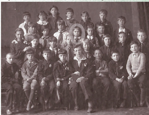
3-ий класс начальной школы