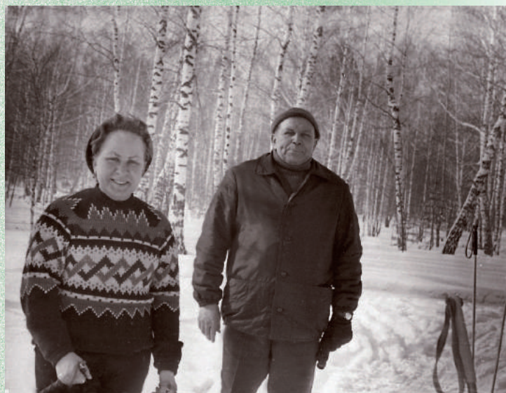
На лыжной прогулке