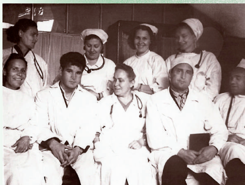
Кафедра госпитальной педиатрии НГМИ