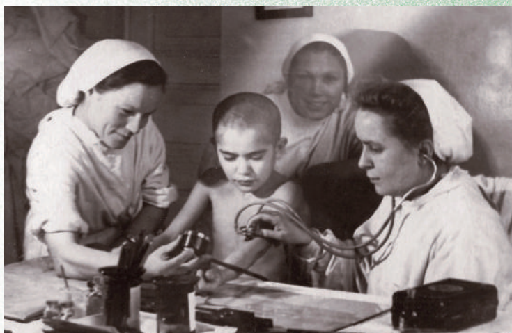
Первый пациент, 1952