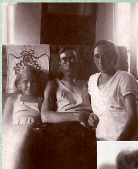
С родителями, 30-е годы