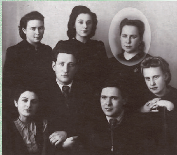
Бюро ВЛКСМ НГМИ, 1952