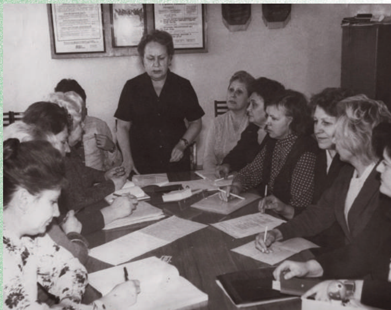
Заседание кафедры госпитальной педиатрии, 80-е годы