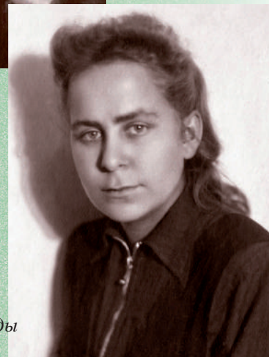
В студенческие годы