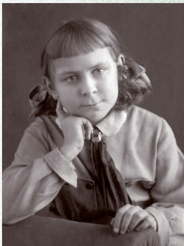
Школьные годы техникума