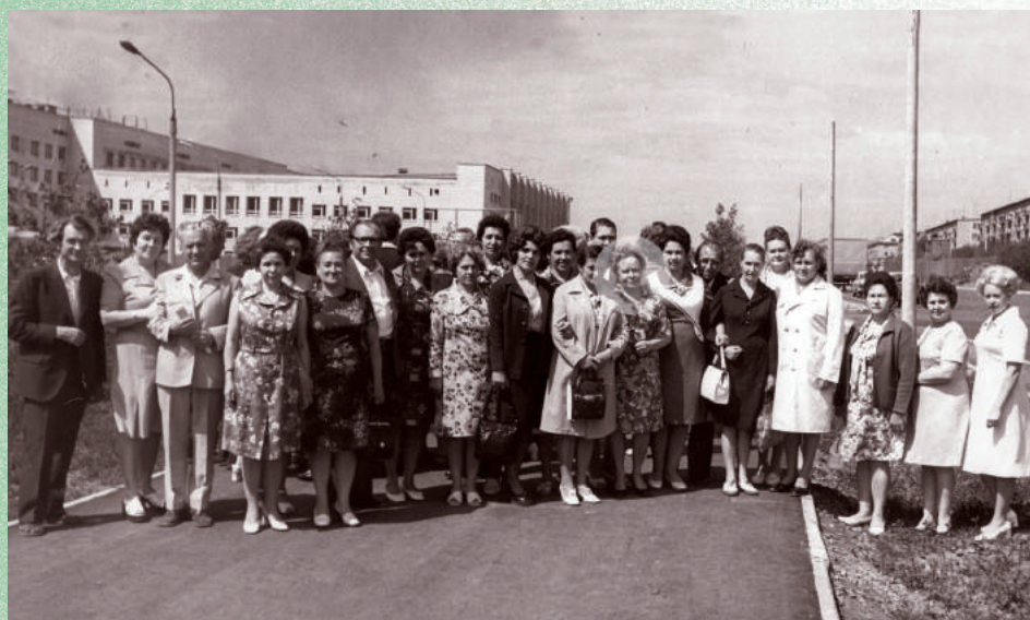
Встреча с однокурсниками в 1977 г.