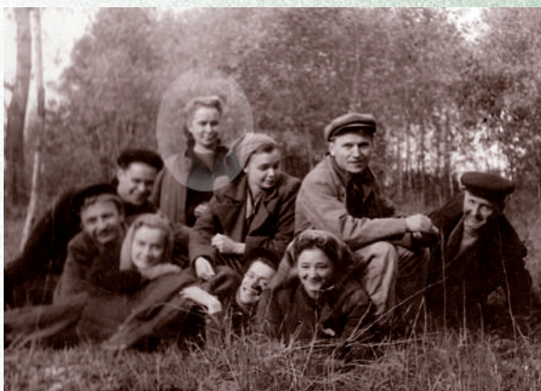
В колхозе, 1948-1949 уч.г.