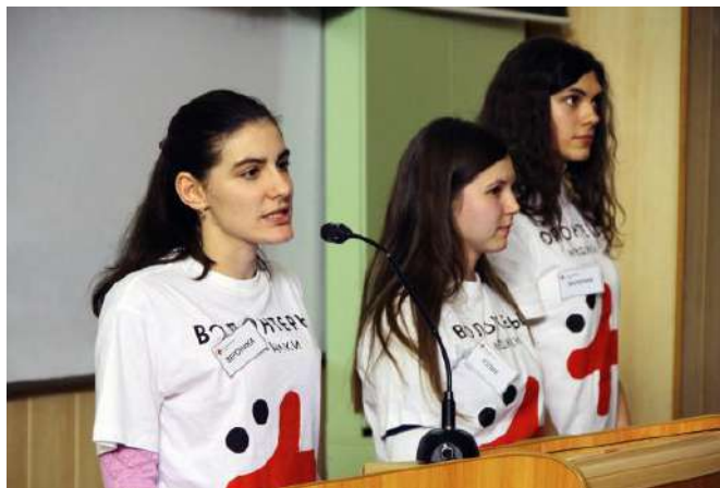
Всероссийская акция «Стоп ВИЧ/СПИД»