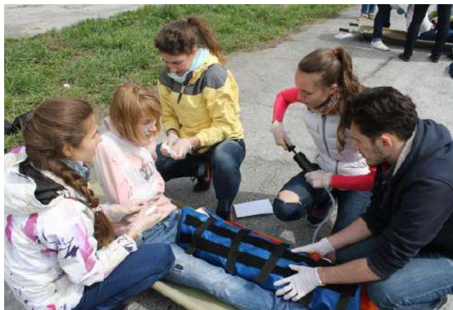
III городская олимпиада по оказанию первой помощи с участием студентов медицинского колледжа