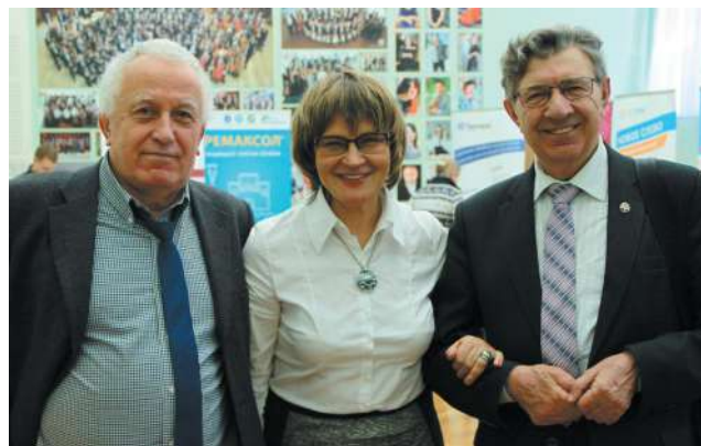
X Сибирский научный гастроэнтерологический форум «Новые рубежи гастроэнтерологии»