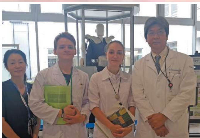
Студенты НГМУ на стажировке в Университете Цукуба (Япония)

По инициативе министерства здравоохранения НСО активисты профсоюза студентов НГМУ провели акцию, приуроченную к Всемирному дню борьбы с инсультом. Волонтеры