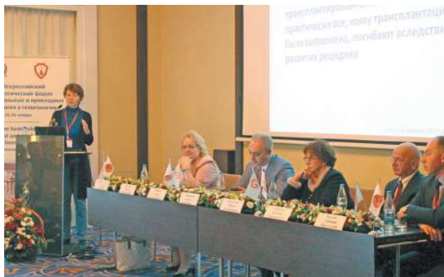
Всероссийский гематологический форум «Фундаментальные и прикладные исследования в гематологии»