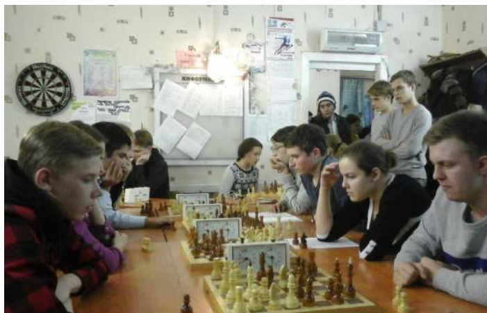
Спартакиада «Приз первокурсника»