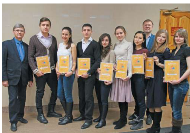
Победители конкурса «ТАКЕДА» – Золотые кадры медицины»