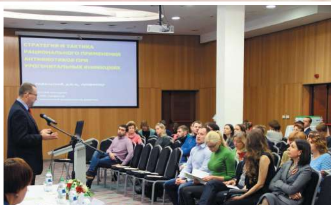
Конференция «Рациональное применение антимикробных средств в амбулаторной практике»