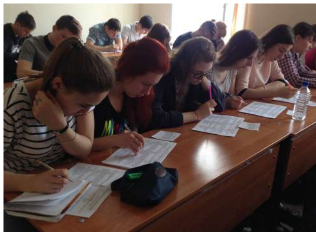
Всероссийский тест по истории Великой Отечественной войны