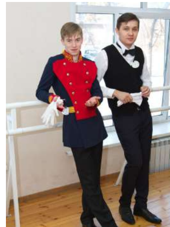
I исторический бал «С танцем сквозь века»