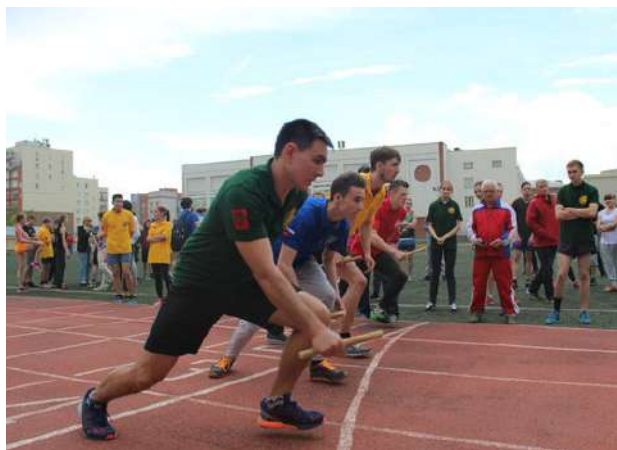
Эстафета памяти полковника м/с А.Е. Акимова