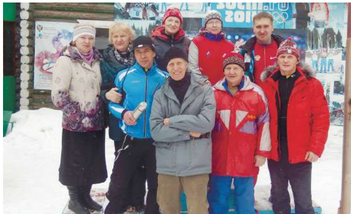
Команда ППС на спартакиаде «Бодрость и здоровье»