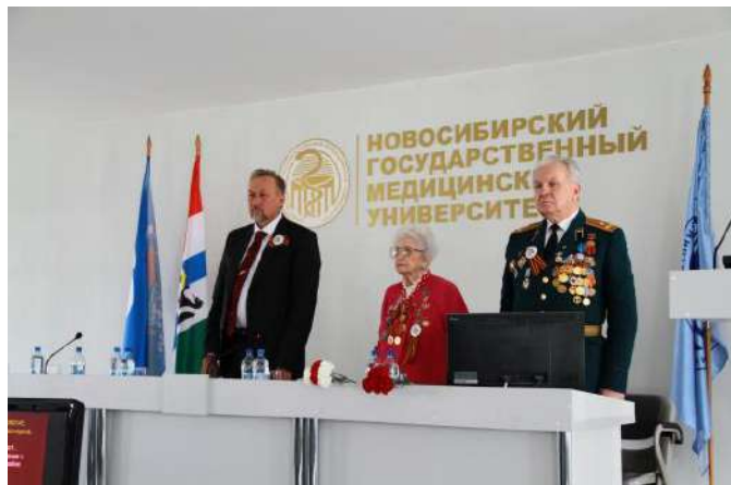
Конференция, посвященная 71-й годовщине Победы в Великой Отечественной войне