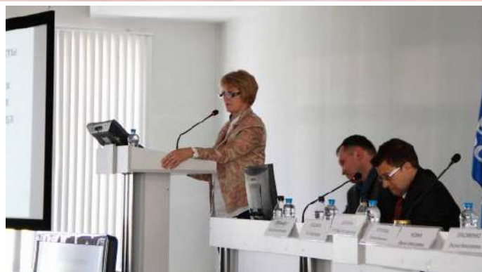
Межрегиональная НПК «Актуальные вопросы медицинской реабилитации: инновационные технологии, диетология, традиционные аспекты»