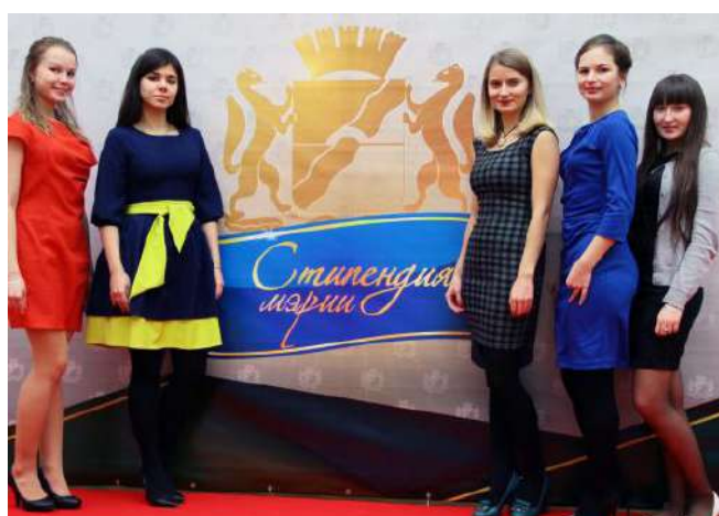
Студенты НГМУ - стипендиаты мэрии