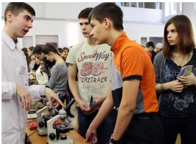
День открытых дверей