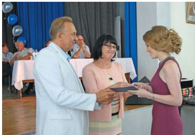
Вручение дипломов выпускникам стоматологического факультета