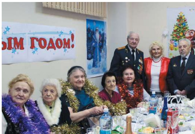
Новогоднее мероприятие для ветеранов НГМУ