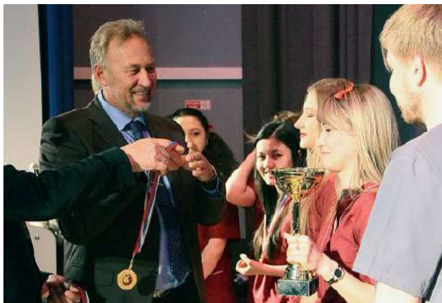
IV Паназиатская олимпиада по акушерству и гинекологии