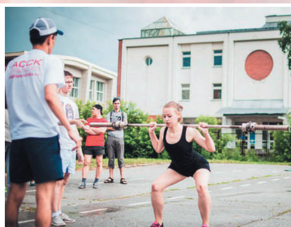
Соревнования по дисциплине «CrossFit»