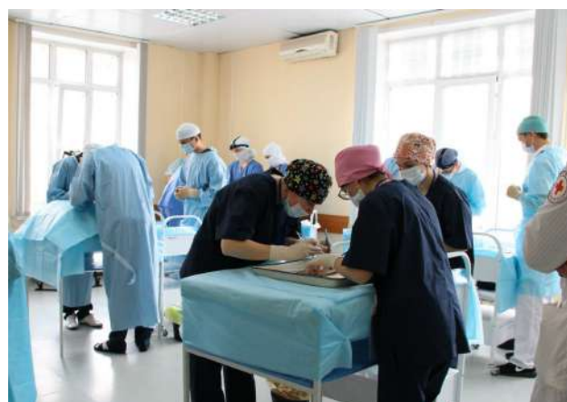
VII региональная олимпиада по хирургии СФО