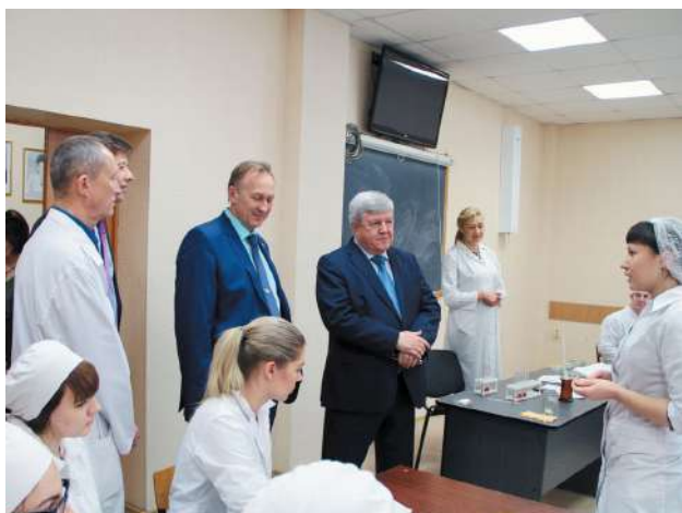
Полномочный представитель Президента РФ в СФО Н.Е. Рогожкин в НГМУ