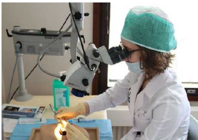
II Всероссийская олимпиада по офтальмологии