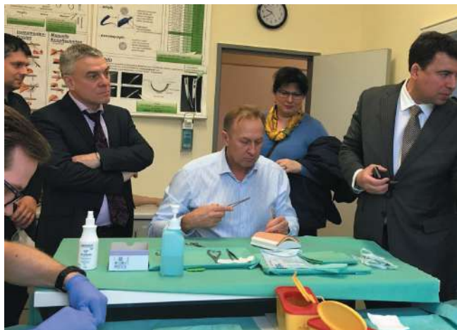
Посещение делегацией НГМУ университетов Германии