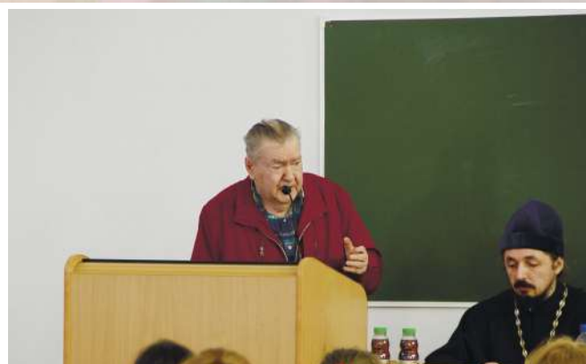
5-ая региональная НПК «Современные аспекты формирования здорового образа жизни»