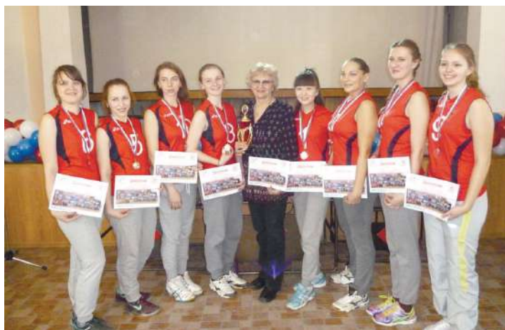
Команда НГМУ по волейболу