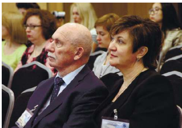
20-ая межрегиональная НПК «Актуальные вопросы неврологии»