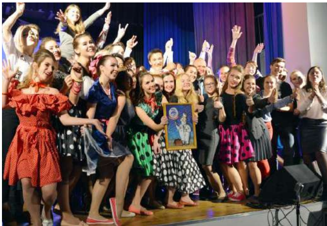
Фестиваль творчества студентов-медиков «MedStars»