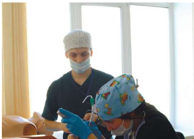
Внутривузовская олимпиада по анестезиологии и реаниматологии