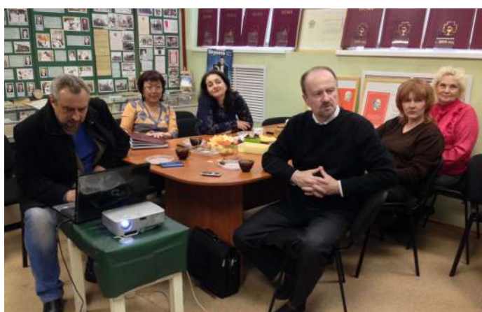
Заседание «Клуба удивительных странствий»