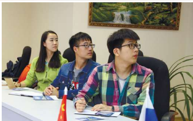
Студенты Гуансинского медицинского университета в НГМУ