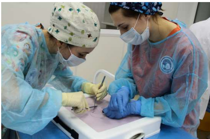
IX внутривузовская олимпиада по хирургии