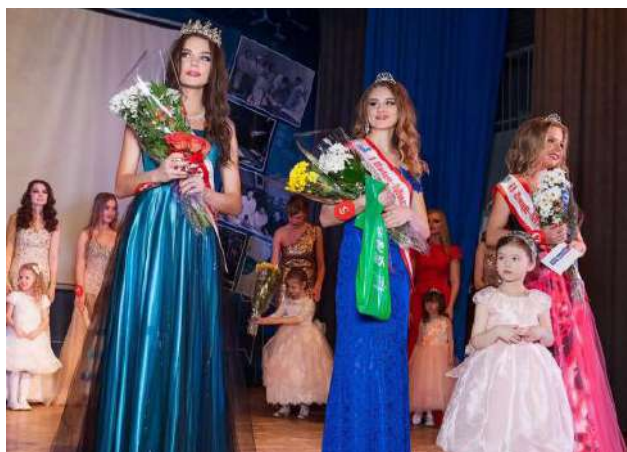
Призеры конкурса «Мисс НГМУ – 2016»