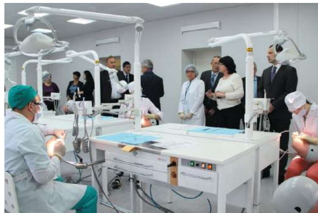
Встреча участников медицинского кластера СФО «Сибирский» в НГМУ