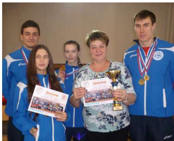
Команда НГМУ по плаванию