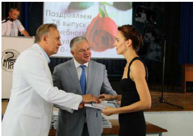
Дипломы выпускникам лечебного факультета вручает министр здравоохранения Новосибирской области О. И. Иванинский