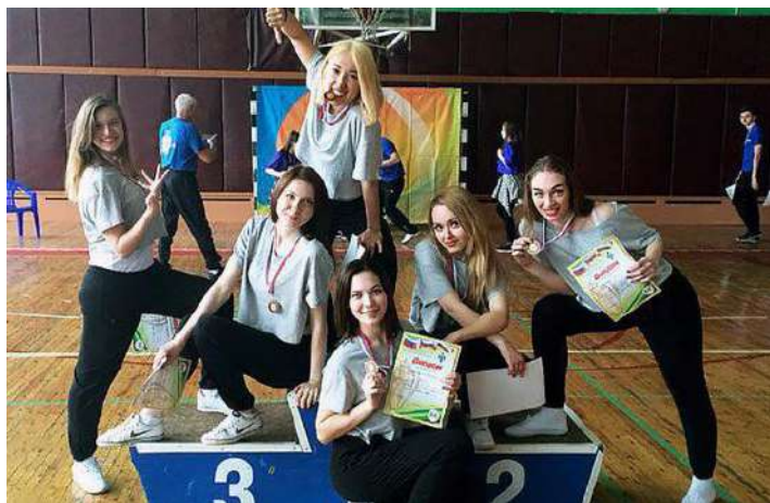
Команда НГМУ по аэробике