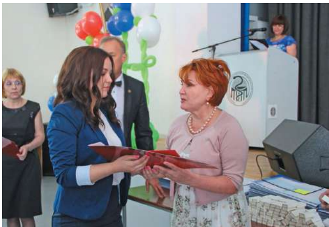
Дипломы выпускникам педиатрического факультета вручает член Совета Федерации Н.Н. Болтенко