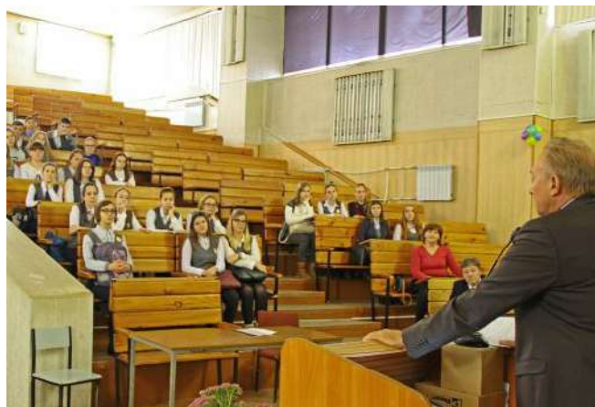
Посещение НГМУ учениками специализированных медицинских классов гимназии № 170