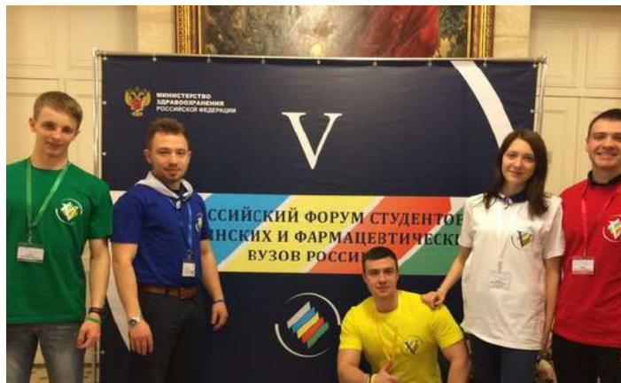
Участники V Всероссийского форума студентов профко- ма медицинских и фармацевтических вузов России