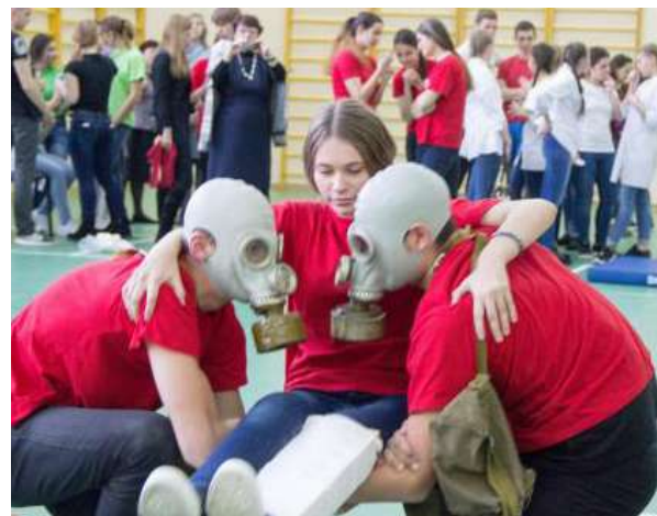
Соревнования по оказанию первой помощи среди школьников

рассказывали о симптомах, характерных для инсульта, и первой помощи, которую необходимо оказать пострадавшему, а также раздавали информационные листовки. Также активисты провели встречу со студентами-медиками в учебных корпусах вуза.