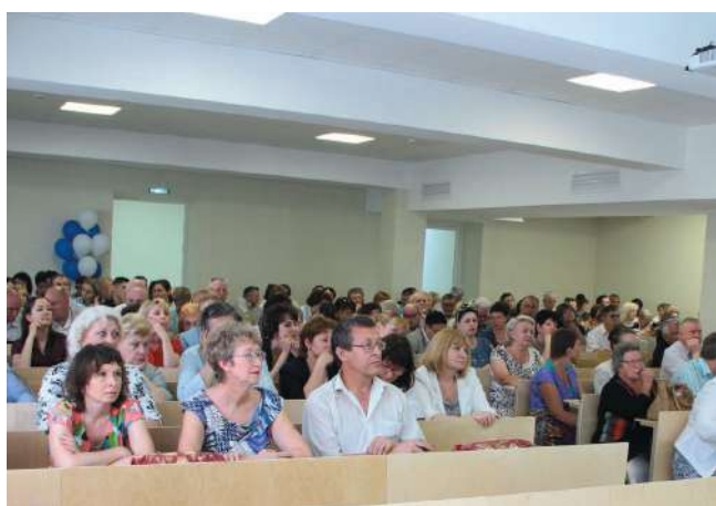
На годовом отчете ректора