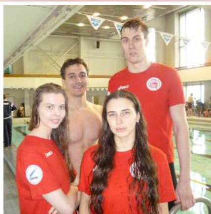
Команда НГМУ по плаванию на фестивале спорта студентов медицинских и фармацевтических вузов РФ (Санкт-Петербург)