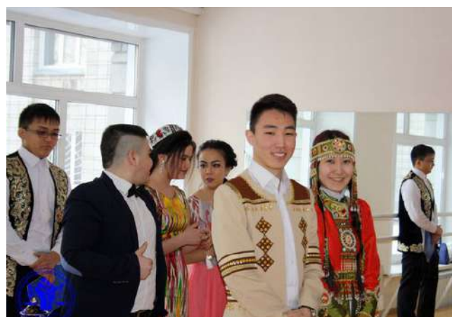
Международный праздник «Наурыз»