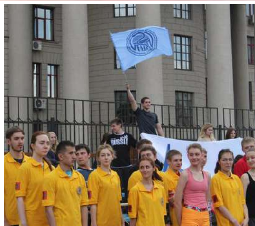
Эстафета памяти полковника м/с А.Е. Акимова