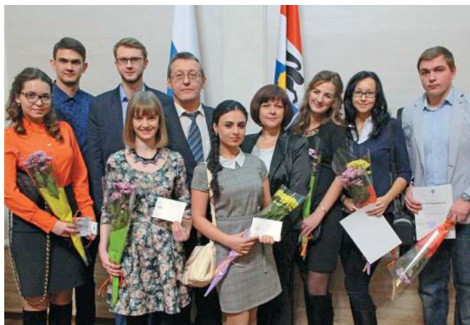
На церемонии вручения стипендий регионального Правительства