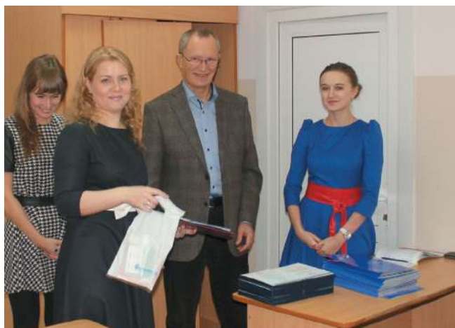
Выпуск фармацевтического факультета (очно-заочная форма обучения)