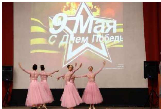
Концерт, посвященный празднованию Победы в Великой Отечественной войне в ГНОКБ