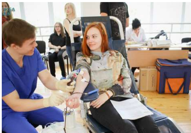
Донорская акция «Наш дар во имя жизни»