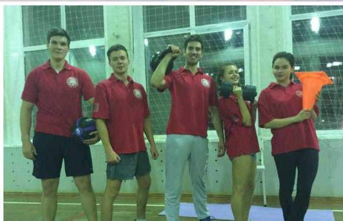
Спартакиада «Приз первокурсника»