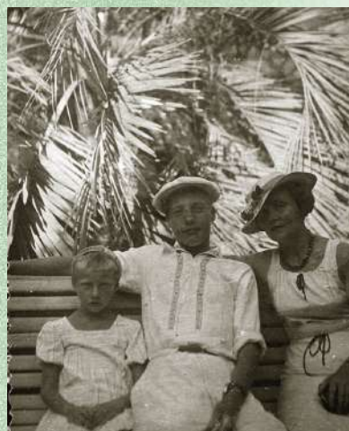
С сестрой и мамой. Ялта, 1939