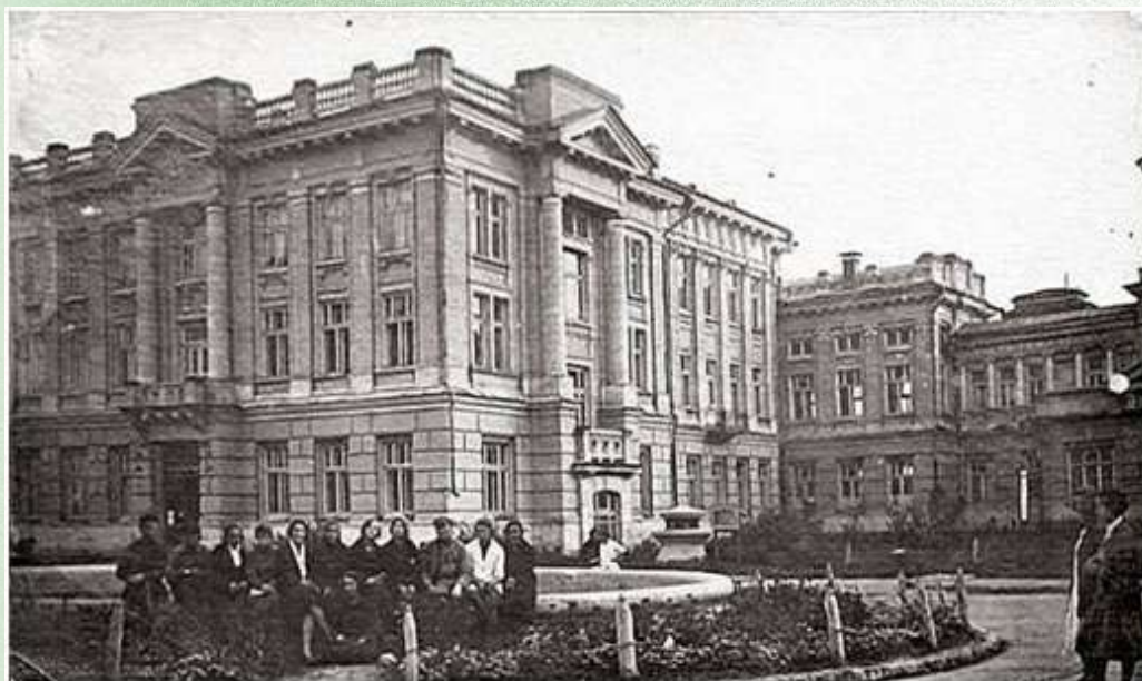
Саратовский медицинский институт