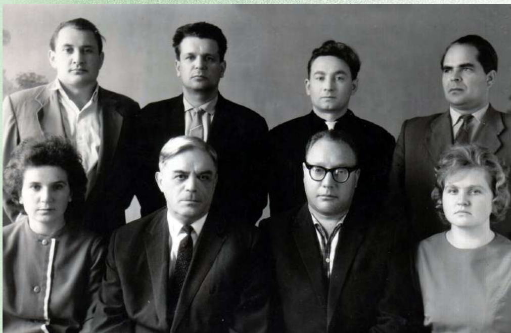
Коллектив кафедры патологической анатомии Благовещенского медицинского института. 1965

щедро делился своими знаниями и опытом с сотрудниками кафедры и студентами. Он много внимания уделял вопросам оптимизации учебного процесса, наглядности преподавания на кафедрах морфологического профиля, воспитанию в студентах клинико-морфологического мышления.