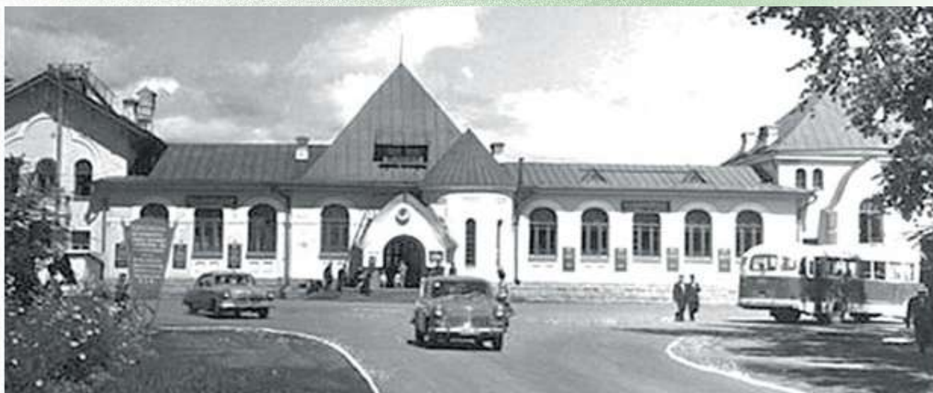
Благовещенский железнодорожный вокзал. 1960