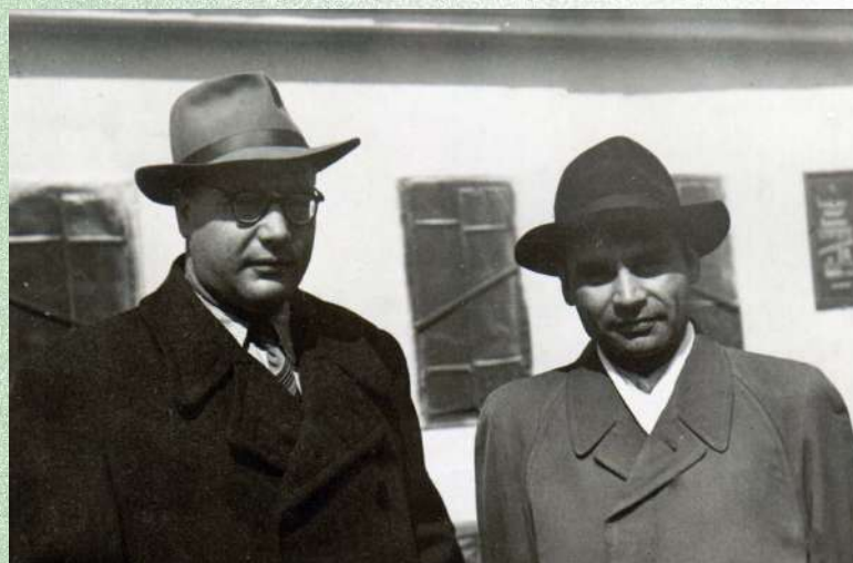
С академиком АМН СССР М. Луценко. Благовещенск 1962