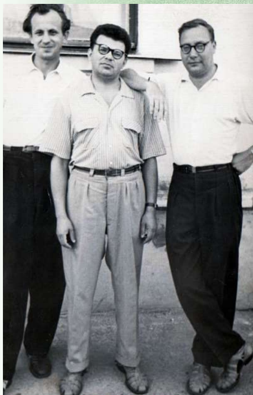
С коллегами. Благовещенск, 1961