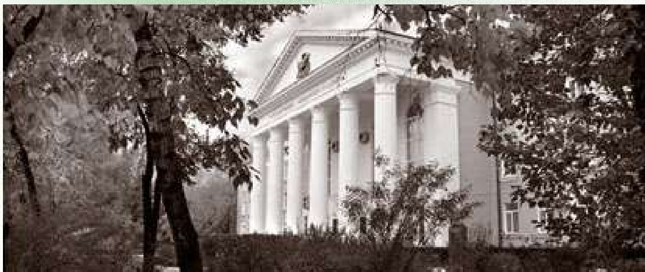
Благовещенский медицинский институт